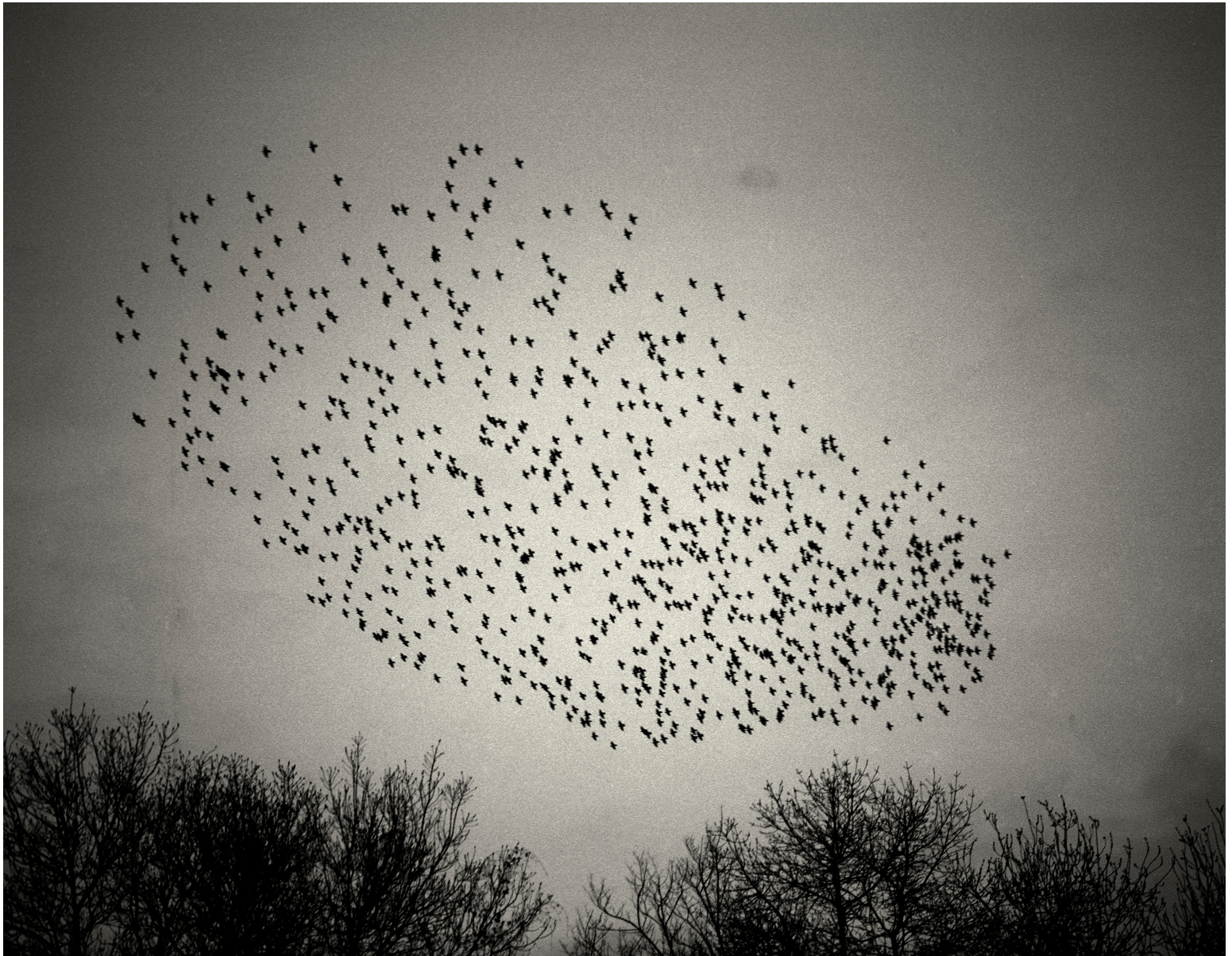
De la série au gré du courant