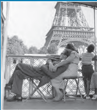
Le bateau-mouche, Paris, 1949